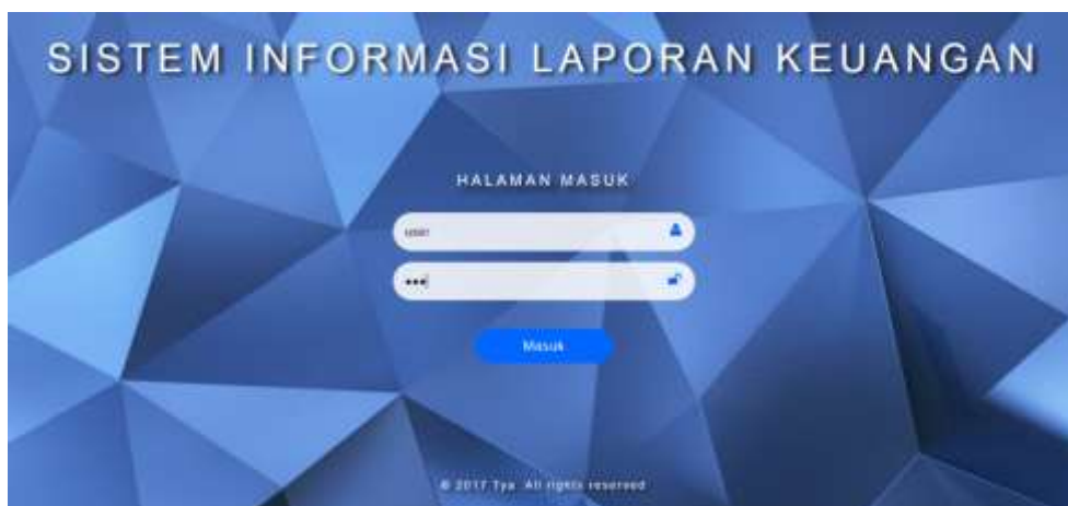
Gambar 4 Form Login

Tahapan implementasi adalah tahap dimana sistem informasi telah digunakan oleh pengguna. kemudian peneliti melaksanakan pelatihan terhadap pengguna dengan memberi penjelasan yang cukup tentang sistem tersebut. Pengujian akhir yang dilakukan oleh peneliti yaitu dengan melakukan implementasi sistem informasi analisis laporan keuangan menggunakan metode vertikal dan horizontal.