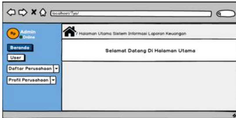
Gambar 2 Rancangan Tampilan Menu Utama

Pada halaman menu utama dalam website ini merupakan tampilan awal website, terdapat menu laporan, perusahaan, kontak, dan grafik. (Safitri et al., 2019), (Ramdan & Utami, 2020).