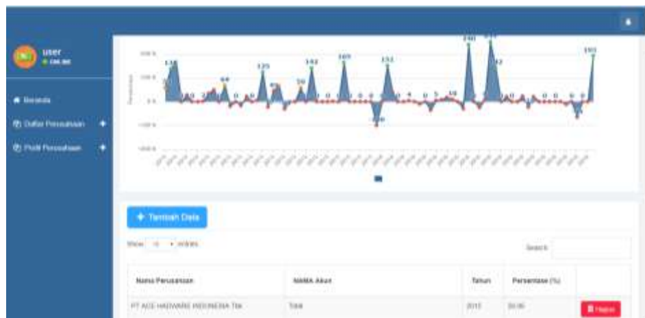
Gambar 6 form Perhitungan Vertikal Horizontal dan Grafik Pertahun.