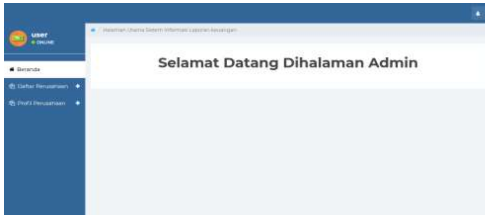
Gambar 5 Form Menu Utama