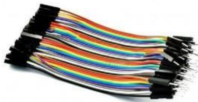
Gambar 3 Kabel Jumper