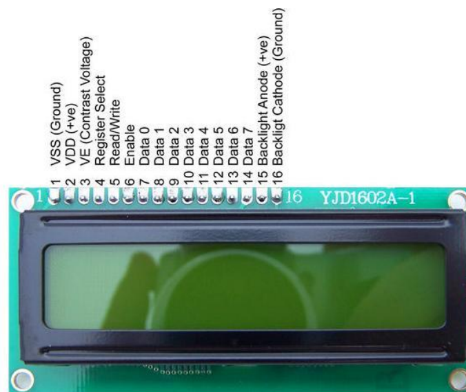
Gambar 4 Liquid Crystal Display

Liquid Crystal Display atau sering disebut dengan nama LCD adalah alat yang sering digunakan untuk menampilkan informasi dari sistem yang berupa tulisan atau teks (Samsugi & Wajiran, 2020) LCD bisa dikatakan alat yang penting bagi pengguna dikarenakan LCD berfungsi untuk menampilkan informasi tampilan interface mengenai yang sedang berjalan. Berdasarkan panjang data antarmuka LCD yang dibedakan menjadi dua jenis yaitu : 4 bit dan 8 bit. Namun, dalam perancangan LCD akan memerlukan banyak pin dari mikrokontroler. Itu karena, mempunyai fungsinya masing-masing yang sangat dibutuhkan untuk mensupport kinerja dari LCD. Untuk menjalankan LCD mikrokontroler biasanya akan sangat membutuhkan perangkat dari sebuah variabel. Pada penelitian ini penulis menggunakan LCD 16 x 2 yang berarti memiliki 16 kolom dan 2 baris karakter.