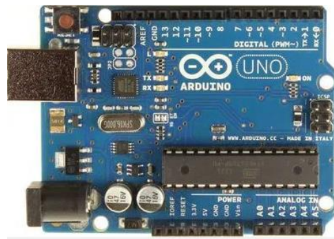
Gambar 1 Arduino Uno

dunia karena mudah dipelajari. Sehingga banyak pemula, hobbyist atau profesional pun ikutserta mengembangkan aplikasi elektronik menggunakan Arduino. Bahasa yang dipakai dalam Arduino adalah bahasa C yang disederhanakan dan relative tidak sulit dengan bantuan pustaka-pustaka (libraries) Arduino (F. Kurniawan & Surahman, 2021; Pindrayana et al., 2018; Riski et al., 2021; Rumalutur & Ohoiwutun, 2018; Samsugi, 2017; Samsugi, Ardiansyah, et al., 2018; Utama & Putri, 2018).